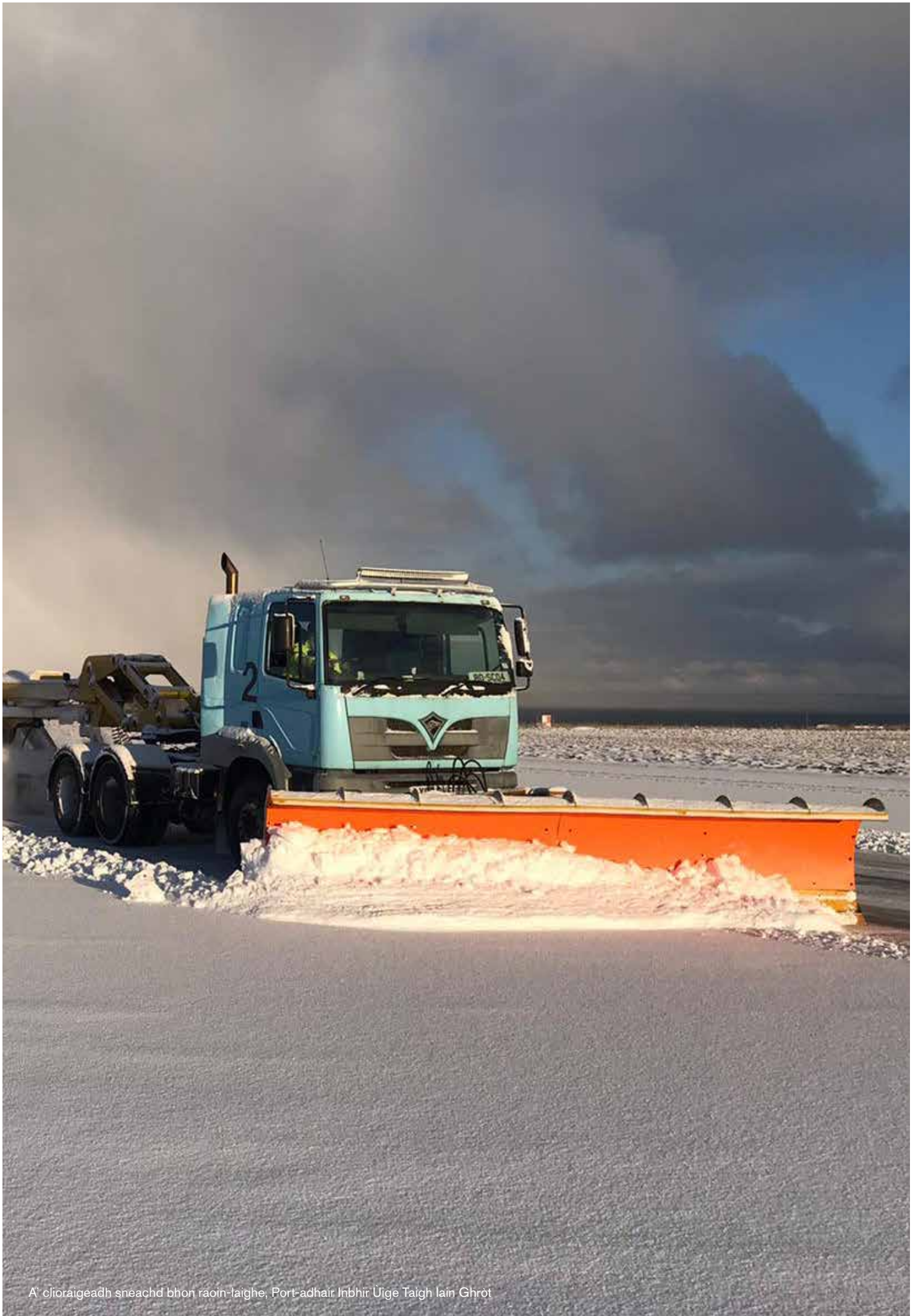
A' clìoraigeadh sneachd bhon raoin-laighe, Port-adhair Inbhir Uige Taigh Iain Ghràt