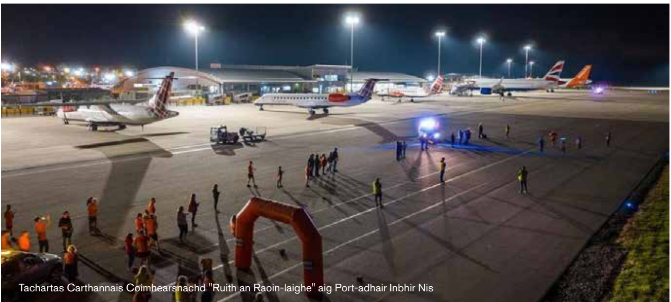
Tachartas Carthannais Coimhearsnachd "Ruith an Raoin-laighe" aig Port-adhair Inbhir Nis