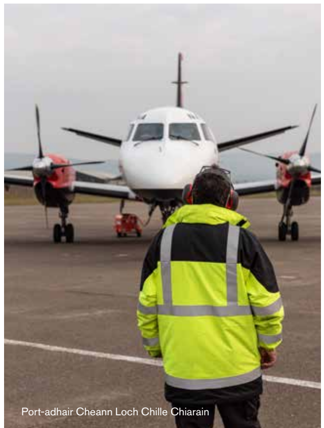
Port-adhair Cheann Loch Chille Chiarain

Nì HIAL ath-sgrùdadh air gnìomhachd aig na puirt-adhair aige gus faighinn a-mach am biodh e comasach na pròiseasan sin a thoirt a-steach gus buannachdan lughdachaidh fuaim is connaidh a libhrigeadh.