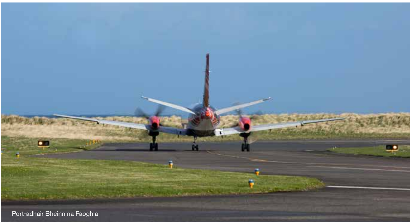
Port-adhair Bheinn na Faoghla

Tha 10 colbhan a' cur fòcas ro-innleachdail air na prìomh chuspairean sin.