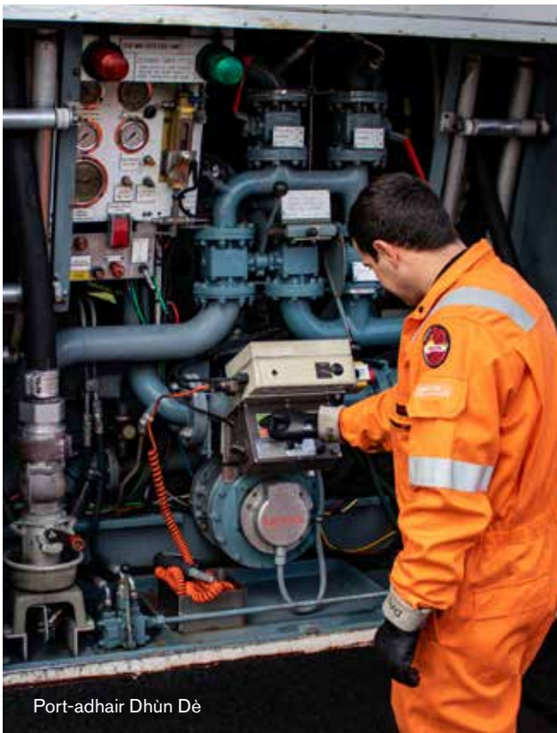
Port-adhair Dhùn Dè