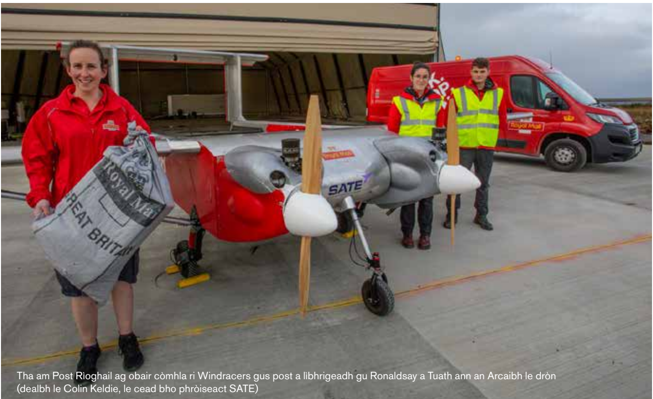
Tha am Post Rìoghail ag obair còmhla ri Windracers gus post a libhrigeadh gu Ronaldsay a Tuath ann an Arcaibh le dròn

Cuidichidh Ìre 2 gus amas a' phròiseict a libhrigeadh a bhith a' leudachadh a sgèile agus a bhith na Ionad Sàr-mhathais airson Seirbheisean-adhair Roinneil Seasmhach san RA.