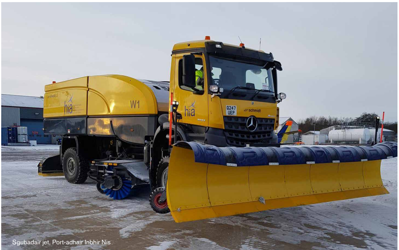
Sgubadair jet, Port-adhair Inbhir Nis