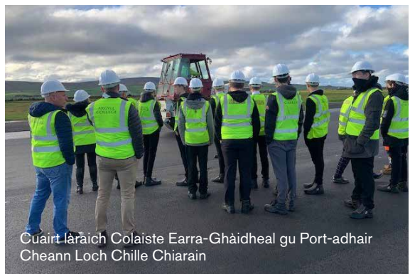
Cuairt làraich Colaiste Earra-Ghàidheal gu Port-adhair Cheann Loch Chille Chiarain